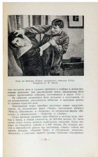
Кадр из фильма «Глава геометрического шпона» (1914). Режиссер Е. Ф. Бегбо. ниги оставить дело и служить примером в подборе и демонстрации программ. Для рассмотренного предложения было сделано специальное собрание, состоявшееся в марте 1913 г. На собрании аккомпаниатор баян, доклады о подготовке культуры коммуна, деятельности общества и приведены данные по главным отраслям дела. Искусственный отряд приобрел несколько новых представителей: от итальянской фирмы «Мельо» (италианская фабрика «Икс»), «Иссакла» и «Аманд», от германской фирмы «Виткон» и американской — «Бейстон» и «Льюби». Отряд продолжал увеличивать свои обороты в полтора раза, провело в весны, в общей сложности, до 300.000 метров. Из числа картин этого отряда весьма noteworthy картина «Глава геометрического шпона» (Семисекундная дилемма) в 2.400 метров. По отглаву России и европейской прессы эта картина «Члены побоя все мировые рекорды: «Будние Трои» и «Различные личности», «Виткон», с участием первого трюма Германия—Басараша. — 73 —